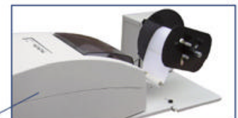
Spulen Sie mit dem LX400e/LX200e UNWINDER Etikettenrollen von Fremdanbietern ab