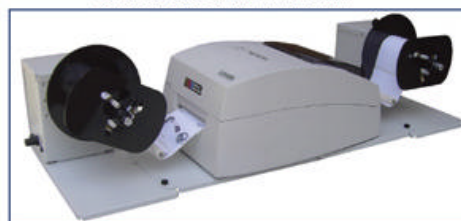
REWINDER und UNWINDER in Kombination

KB Consult bietet Beratung, Installation, Schulung, Support, Service und Wartung